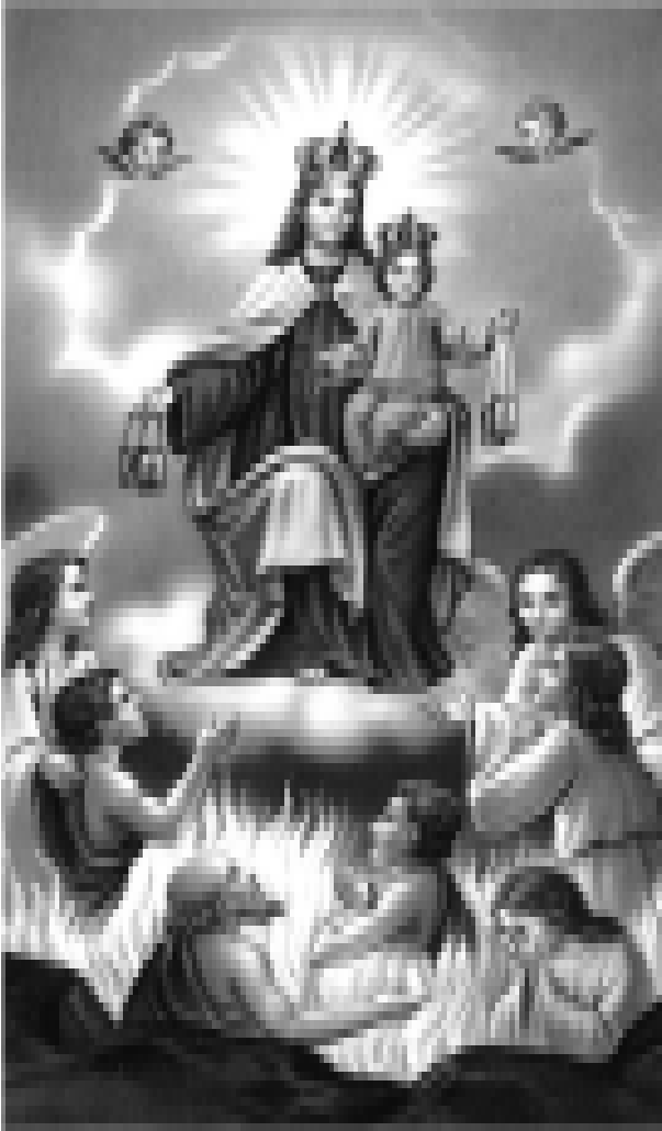
உத. ஆன்மாக்களுக்கு தேவமாதானின் உதவி

உத்தரிக்கிற ஸ்தலத்திலே வாதைப்படுகிற ஆன்மாக்களுடைய வேதனைகளை நம்முடைய ஜெபதவ, தானதர்மத்தினாலும், திருச்சபையின்