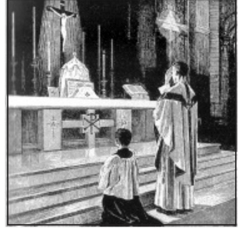
குருவானவர் தம்மீது சீலுவை அடையாளம் வரைகிறார்

பீடத்தின் படிகளில் இறங்கி வரும் குருவானவர், பாவத்தால் வீழ்ச்சியடைந்து சிங்காரத்தோப்பிலிருந்து விரட்டப்பட்ட மனிதனின் பிரதிநிதியாக பீடத்தினடியில் வந்து நிற்கிறார். அங்கே, அவர் தொடங்குகிற செயல்கள் - மிகவும் பரிசுத்தமான தேவ சமூகத்தில் நிற்கும் தமது தாழ்ந்த நிலையை - தமது தகுதியின்மையை உணர்ந்து தம்மைத் தூய்மைப்படுத்தி நிறைவேற்றப் போகும் பலிக்கு தகுதியாக்கும்படி தேவ சமூகத்தை மன்றாடும் விதமாகவும் இருக்கின்றன. மேலும் பழைய ஏற்பாட்டில் மனுக்குலத்திற்கு வாக்களிக்கப்பட்ட இரட்சகரை ஆவலோடும், நம்பிக்கையோடும் எதிர்பார்த்திருந்த இஸ்ராயேல் மக்கள் எழுப்பிய ஏக்கத்தின் குரலாய் எதிரொலிக்கின்றன.