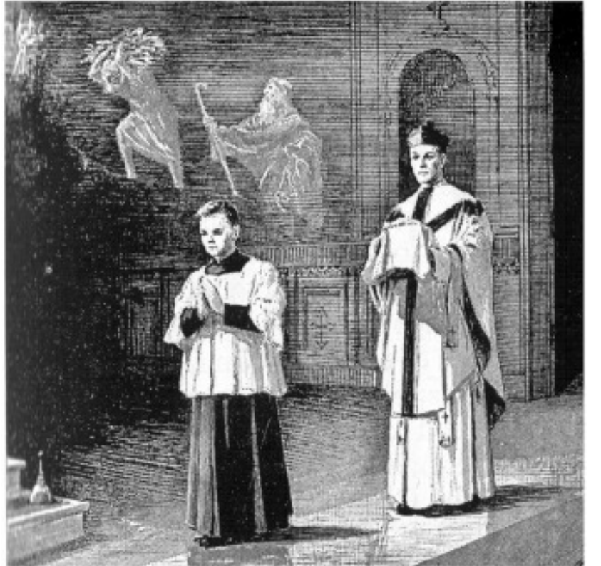
பூசை பாத்திரத்தோடு குருவானவர் பீடம் நோக்கி வருகிறார்

பின்னர், பீடத்தினடியில் இறங்கி வந்து பரிசாரகருடன் சேர்ந்து பூசையின் சாதாரணப் பாகத்தின் (Ordinary of the Mass) செபங்களை ஆரம்பிக்கிறார். விசுவாசிகள் அனைவரும் முழந்தாள் படியிட்டு அச்செபத்தில் கலந்து கொள்வர்.