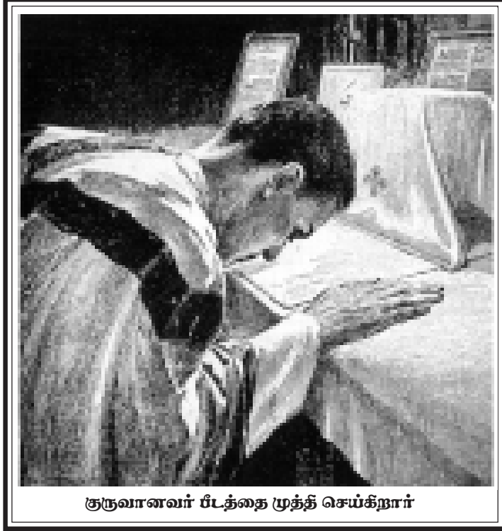
குருவானவர் பீடத்தை முத்தி செய்கிறார்

பீடத்தை நோக்கி ஏறிச்சென்று தாழ்ச்சியோடு தலை குனிந்து பீடத்தின் மீது தனது கரங்களைக் குவித்து வைத்த குருவானவர் தமது தகுதியற்ற நிலையை உணர்கிறார். மீண்டும் தமது பாவங்களையும், அதன் விளைவுகளையும் நினைக்கிறார். இதனால் சஞ்சலமடைந்தவராக அவற்றிலிருந்தும் விடுபடவேண்டும் என்ற ஆவலோடு, இரண்டாவது ஜெபத்தைப் பின்வருமாறு ஜெபிக்கிறார்: “Oremus te Domine... ஆண்டவரே, இங்கு எந்தெந்த அர்ச்சிஷ்டவர்களுடைய பரிசுத்த பண்டங்கள் இருக்கின்றனவோ, அவர்களுடையவும், சகல அர்ச்சிஷ்டவர்களுடையவும் பேறுபலன்களைக் குறித்து என் பாவங்களையெல்லாம் மன்னிக்கத் தயை செய்தருளும்படி தேவீரை மன்றாடுகிறேன். ஆமென்” . இதனால் குரு, தமது எல்லாப் பாவங்களிலிருந்து உத்தமமான முறையில் தம்மைச் சுத்தமாக்கும்படியாக விண்ணப்பித்து, அதற்கு வலு சேர்க்கத்தக்கதாக அர்ச்சிஷ்டவர்களின் பேறுபலன்களையும் தம்மோடு சேர்த்து மன்றாடுகிறார்.