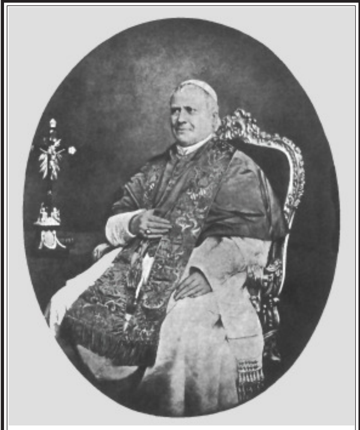
முத். 9-ம் பத்திநாதர்

இவ்வாறு மாதா கூறிய தீர்க்கத்தரிசனம் அப்படி நிறைவேறியது! ஈக்வடார் நாட்டை கபிரியேல் கார்சியா மொரேனோ (1821 - 1875) என்ற நல்ல கத்தோலிக்க ஜனாதிபதி ஆண்டார். அவர் தமது குடியரசு நாட்டை 1873-ம் ஆண்டில் சேசுவின் திரு இருதயத்திற்கு அர்ப்பணித்தார். மாதா முன்னுரைத்தது போல அவர் வேத விசுவாசத்திற்காகவும், கிறீஸ்தவ சிநேகத்திற்காகவும் வேதசாட்சிய முடியை