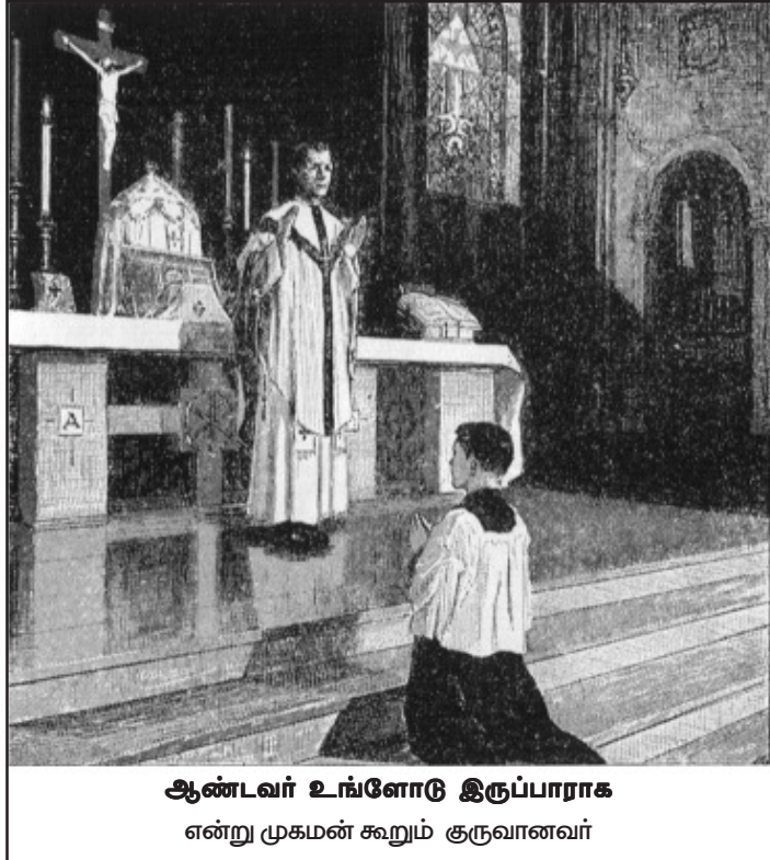
ஆண்டவர் உங்களோடு இருப்பாராக என்று முகமன் கூறும் குருவானவர்

பூசையின் முக்கிய ‘7’ நிலைகளில் ‘7’ தடவைகள் “ஆண்டவர் உங்களோடிருப்பாராக” என்ற மங்கள வாழ்த்தை குருவானவர் கூறுவதானது: இஸ்பிரீத்துசாந்துவின் ‘7’ வரங்களை விசுவாசிகளுக்குப் பெற்றுத் தருவதாக அமைந்துள்ளது. ஒவ்வொரு தடவை குருவானவர் வாழ்த்தும் போது விசுவாசிகளுக்கு இஸ்பிரீத்துசாந்துவின் ‘7’ வரங்களில் ஒன்றை வழங்குவதாகவும், அதனையே குருவானவரும் பெற்றுக்கொள்ள விசுவாசிகள் “உமது ஆவியோடும் இருப்பாராக” என்று பதிலுரைத்து இறைஞ்சுவதாகவும் திகழ்கின்றது. பலிபூசையின் குறிப்பிட்ட ‘7’ நிலைகளில் இவ்வேழு வரங்களும் மிகப் பொருத்தமுடன் வழங்கப்படுகின்றன.