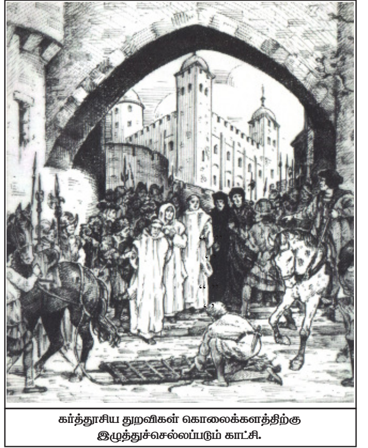
கர்த்தாசிய துறவிகள் கொலைக்களத்திற்கு இழுத்துச்செல்லப்படும் காட்சி.