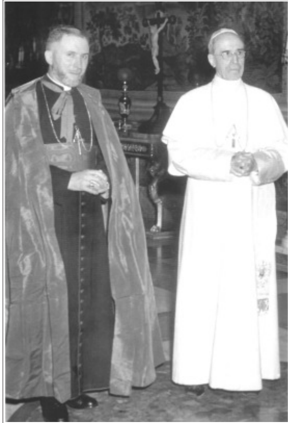
பாப்பானவர் 12-ம் பத்திநாதருடன் வந். லெஃபவர் ஆண்டகை

நோயுற்று மரண ஆபத்திலிருக்கும் ஆத்துமங்களுக்கு மட்டுமே கொடுக்கப்படக்கூடிய இத்தேவதிரவிய அநுமானம் இப்பொழுது வயது முதிர்ந்த அனைவருக்கும் கொடுக்கக்கூடிய ஒன்றாக மாற்றப்பட்டுவிட்டது. சில குருக்கள் வெறும் ஓய்வுபெறும் வயதை எட்டியவர்களுக்குக்கூட இதனைக் கொடுக்கிறார்கள். இனி இந்த தேவதிரவிய அநுமானம், ஆத்துமத்தை அதனுடைய கடைசித் தருணத்திற்குத் தயார் செய்யும் தேவதிரவிய அநுமானமாக, மரணத்திற்கு முன் ஆத்துமத்தில் உள்ள பாவக்கறைகளை கழவி சர்வேசரனுடைய கடைசி ஐக்கியத்திற்குத் தயார் செய்யும் தேவதிரவிய அநுமானமாகக் கருதப்படுவதில்லை!