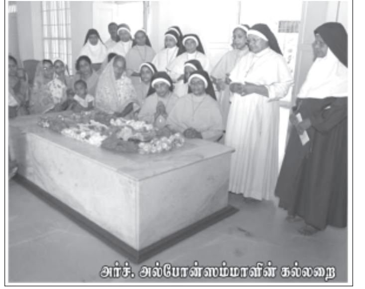
அர்ச். அல்போன்ஸம்மாளின் கல்லறை