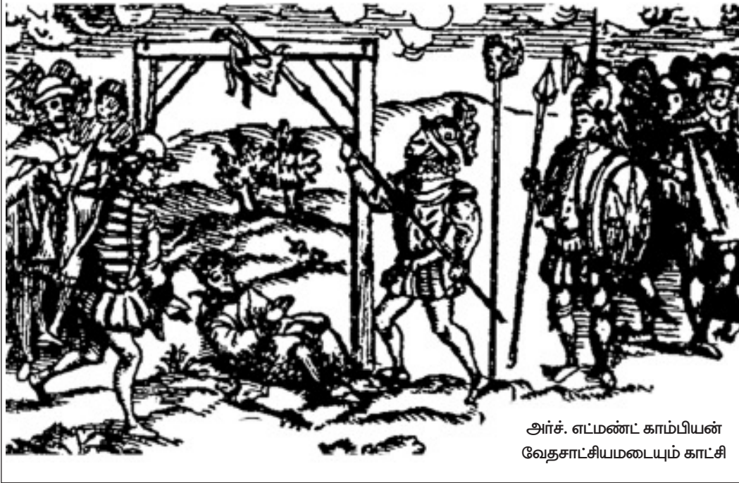
அர்ச். எட்மண்ட் காம்பியன் வேதசாட்சியமடையும் காட்சி

வரலாறு ஒன்றையும் எழுதி அதற்குப் புகழ் சேர்த்தார்.