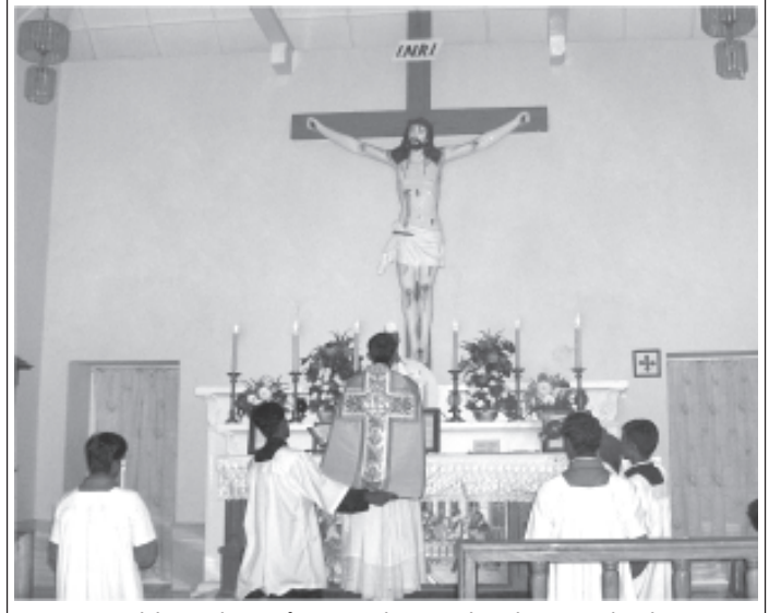
அர்ச். அல்போன்ஸா கல்லறைச் சிற்றாலயத்தில் நிறைவேற்றப்பட்ட திரிதெந்தீன் தீவ்விய பலியூசை

புதிய அர்ச்சியசிஷ்டவளின் இந்த மகிமை, நமது இந்திய தேசத்தில் மீட்பின் வரப்பிரசாதங்களை அபரிமிதமாகப் பொழிந்து அஞ்ஞான இருள் நீக்கும் என்று திடமாக நம்புகிறோம். சுத்தோலிக்க மக்களாகிய நமக்கு, நமது விசுவாச ஞானவாழ்வில் ஊக்கத்தையும், திடத்தையும் தரும் என்பதில் ஐயமில்லை. அர்ச்சியசிஷ்டப்பட்டம் வழங்கப்பட்ட நாளில் திரிகால ஜெபத்தின்போது பரிசுத்த பாப்பானவர் 16-ம் ஆசீர்வாதப்பர், “அர்ச். அல்போன்ஸாவின் வீர