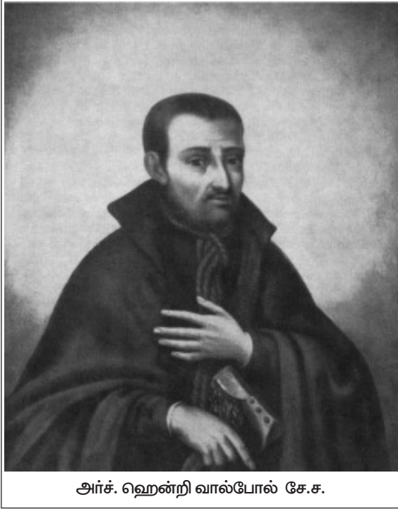
அர்ச். ஹென்றி வால்போல் சே.ச.

1581 டிசம்பர் முதல்நாள் அன்று அதிகாலையிலிருந்தே மழை - ஒரே அடை மழை! விடாது பெய்யும் அந்த மழையையும் அலட்சியம் செய்து பெரும் கூட்டம் லண்டன் டைபர்ன் (Tyburn) சிறைச்சாலையின் முகப்பிலே நின்றுகொண்டிருந்தது. வழக்கமாக அங்கே மரண தண்டனை விதிக்கப்படும். மக்கள் முன்னிலையில் பகிரங்கமாக நிறைவேற்றப்படும். தண்டனைக் காட்சியைக் காண மக்கள் வருவர். ஆனால் இன்று வழக்கத்துக்கு மாறாக மக்கள் பெருங்கூட்டமாகக் கூடியுள்ளனரே? என்ன காரணம், யார் தண்டனை பெறப்போகிறார்கள்? ஆம்! இன்று லண்டன் மாநகரின் புகழ்பெற்ற பேச்சாளரும் எழுத்தாளரும் சேச சபை குருவுமான எட்மண்ட் காம்பியன் மரண தண்டனை பெறவிருக்கிறார்.